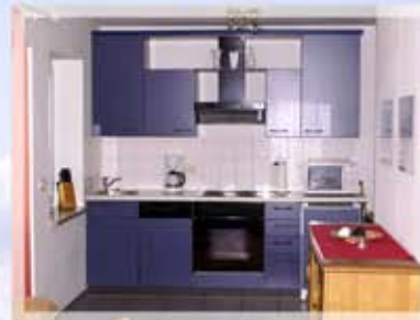
Wohn- / Essbereich und Küchenzeile