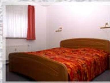
Schlafraum eins und Schlafraum zwei